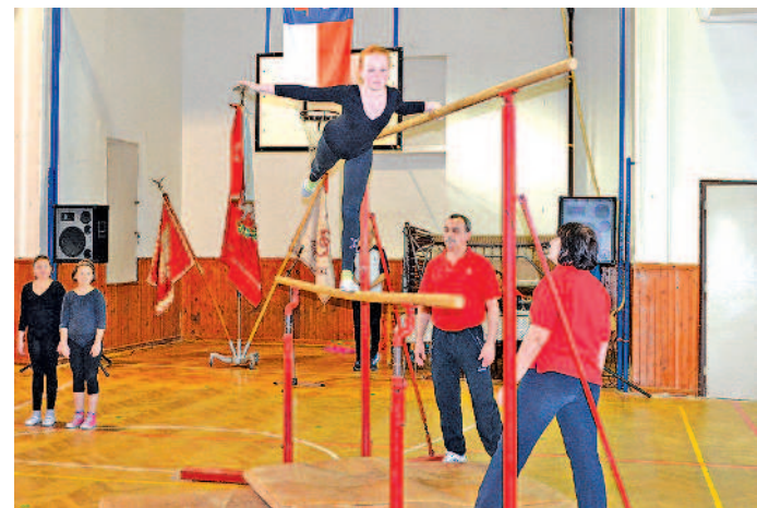
BRADLA A ŠVÉDSKÁ BEDNA. Žákyně Sokola předvedly své gymnastické dovednosti.